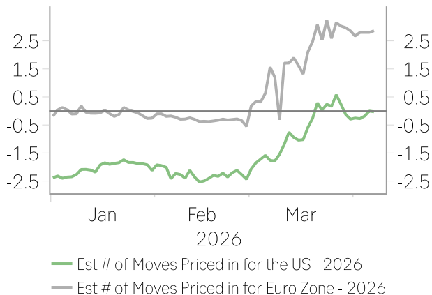
Estimated number of interest rate cuts (-) / hikes (+) for the end of 2026

Lähi-idän geopolitiittinen tilanne oli keskeisin markkinaa ohjaava tekijä koko maaliskuun ajan. Kuukauden alussa hyökkäykset Hormuzinsalmen läheisyydessä ja Qatarin LNG-infrastruktuuriin nostivat energiariskin nopeasti esiin, ja Euroopan kaasun hinta reagoi voimakkaasti. Kuukauden aikana nähtiin myös iskuja Iranin energiainfrastruktuuriin (mm. South Pars ja Kharg Island), IEA ilmoitti strategisten öljyvarastojen vapauttamisesta (400 miljoonaa barrelia) ja G7-maat keskustelivat lisätoimista markkinoiden vakauttamiseksi. Samalla poliittinen viestintä pysyi epäjohtonmukaisena: Trump asetti määräaikoja Hormuzinsalmen avaamiselle, uhkasi iskuilla ja perääntyi osin myöhemmin viitaten käynnissä oleviin neuvotteluihin. Huhtikuun alussa geopolitiittinen epävarmuus laajeni myös turvallisuuspolitiikkaan, kun Trump kommentoi mahdollisuutta Yhdysvaltojen Nato-linjauksen muuttamisesta. Tämä lisäsi epävarmuutta erityisesti Euroopan näkymiin ja nosti riskipremioita, sillä mahdolliset muutokset transatlanttisessa turvallisuusrakenteessa voivat heijastua laajasti markkinoihin.